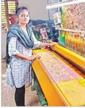
పవర్ లామ్ పై చీర నేస్తూ..

13 th Hockey National Selection Team Training Jun, 2023