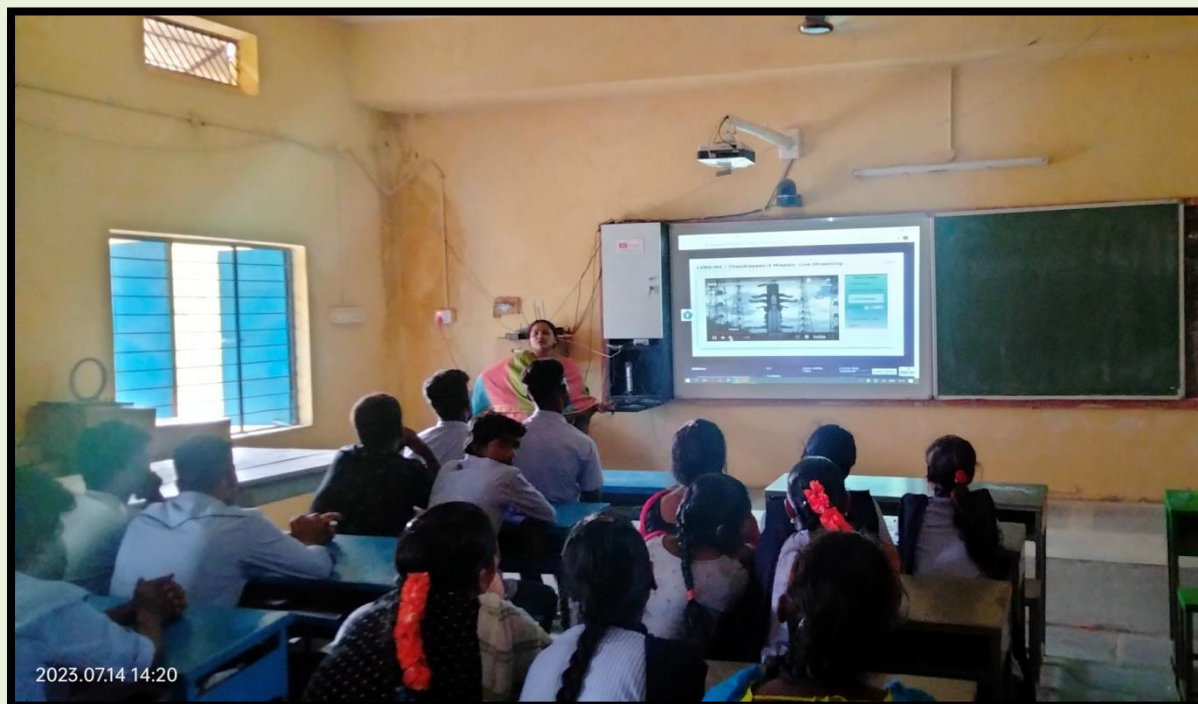
Students watching the streaming video of CHANDRAYAAN – 3 Launching in the Virtual Classroom